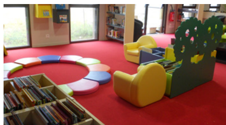
Des partenariats et des animations en perspective !

Horaires d'ouverture : lundi de 16 h 45 à 18 h 15, mercredi de 16 h à 18 h et samedi de 10 h à 12 h.