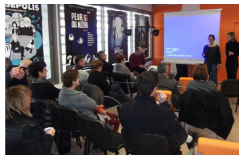
Avec e-médi@, vous pouvez organiser des séances de projection pour votre public*

* Pour connaître les modalités de diffusion en toute légalité, contactez la Direction des Bibliothèques