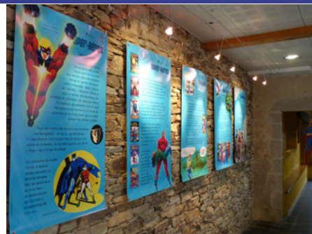
Les Super-héros débarquent à la Vendéthèque de Montaigu