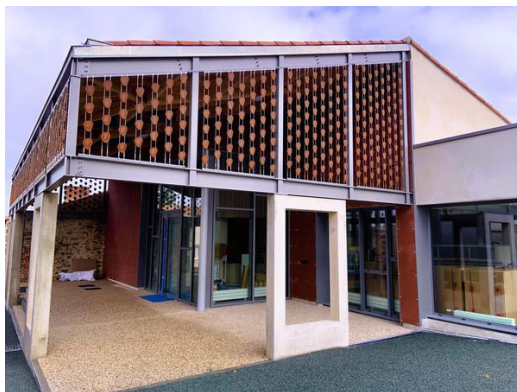
Médiathèque de Saint-Avaugourd-des-Landes

La Direction des Bibliothèques a apporté son soutien technique (relecture du projet culturel, conseils, formation d'une partie de l'équipe), et a fourni un prêt exceptionnel d'environ 700 documents.