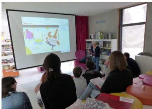
Atelier Storyplay's par Brigitte Noël de la Médiathèque de Carquefou

Les journées de rencontres numériques sont rééditées chaque année, avec des thématiques différentes. N'hésitez pas à vous inscrire.