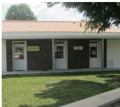
Bibliothèque du Gué-de-Velluire