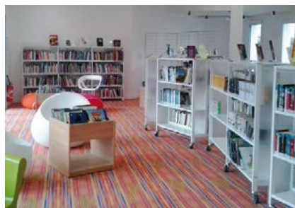
Des meubles sur roulettes permettant différentes utilisations de l'espace

L'équipe bénéficie également de l'appui des bibliothécaires du réseau intercommunal de lecture publique de Vie et Boulogne.