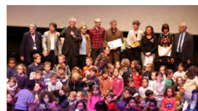
Remise nationale du prix Chronos de littérature, le 20 mai 2019, à la Roche-sur-Yon, par le Président du Département de la Vendée

Rendez-vous l'année prochaine pour l'édition 2020 !