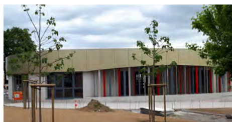
Médiathèque de Saint-Fulgent

Ce projet a bénéficié de l'accompagnement financier du Département dans le cadre du Contrat Vendée Territoire et de la DRAC.