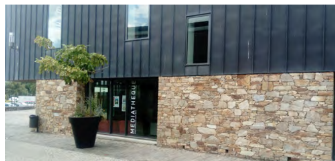
Médiathèque de Brétignolles-sur-Mer

Nous sommes heureux de vous annoncer l'arrivée des bibliothèques de Sainte-Hermine, de Brétignolles-sur-Mer et du Fenouiller, dans le réseau départemental ! Pour la commune du Fenouiller il s'agit d'une création de bibliothèque, la commune ayant souhaité bénéficier d'un équipement de proximité en plein centre-bourg.