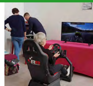
La Journée de Rencontres Numériques propose des ateliers pratiques comme le test de jeux vidéos.

Pour tout renseignement sur l'offre de valises "jeux vidéo" de la Direction des Bibliothèques : numeriquebdv@vendee.fr ou 02 28 85 79 00