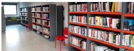
Bibliothèque de Tiffauges

L'ouverture de la future bibliothèque de Tiffauges participe à un projet d'envergure : la réhabilitation du site de l'ancienne usine Colette de Retz.