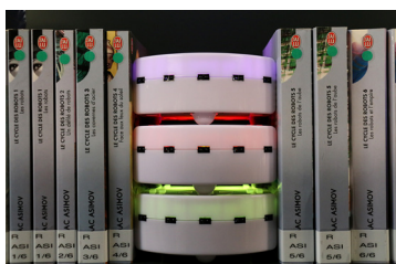
Les robots prennent vie dans votre bibliothèque

Renseignements : 02 28 85 79 00 https://bibliotheque.vendee.fr formationsbdv@vendee.fr