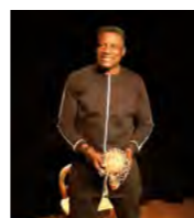
Petit retour en images Taxi conteur