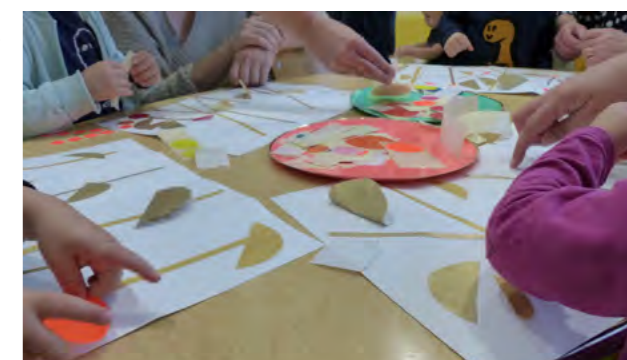
Création de livres par les tout-petits

De nouvelles actions seront proposées sur le département en 2022.