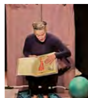
Petit retour en images Théâtre des 7 lieues

21 dates sont programmées par le Département de septembre 2021 à juin 2022 dans les bibliothèques de Vendée. Retrouvez l'intégralité du calendrier sur notre portail, rubrique Publics et Action Culturelle https://bibliotheque.vendee.fr .