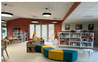
Nouvelle bibliothèque de Doix-lès-Fontaines

La DRAC et la Direction des Bibliothèques ont apporté leur soutien technique dès l'élaboration du projet culturel. Le coût du projet est de 500 000 €, subventionné en partie par la DRAC et le Département. L'aide départementale s'élève à 100 476,85 € pour le bâtiment, 8 156,39 € pour le mobilier, et 3 354,90 € pour l'informatique.