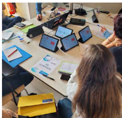
Atelier sur la création d'une BD numérique